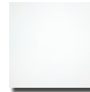
OWAplan 90 -Platte / tile