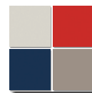
OWAplan color feine oder sehr feine Struktur *2 / fine or ultra-fine structure *2 RAL-/NCS-Farbtöne auf Anfrage / RAL-/NCS-color on request