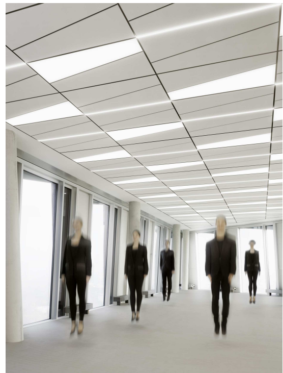
Trapeze – Dynamik in der Deckengestaltung