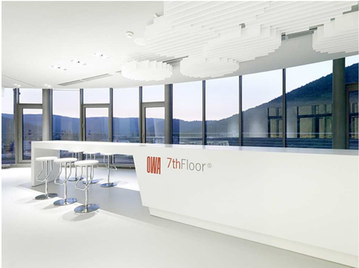
Blick zum Empfangstresen im OWA-Show-Room 7th Floor

Anlässlich der Expo Real in München im Oktober 2013 findet die Preisverleihung statt.