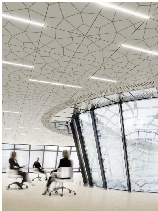
Oriental – Faszination des Ornamentalen