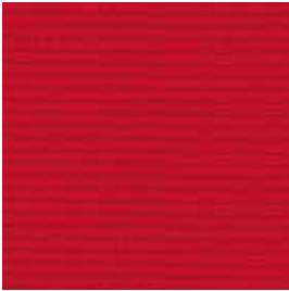
Rot | red