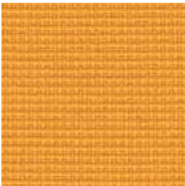
Gelb | yellow