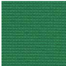
Grün | green