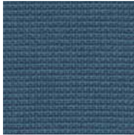
Blaugrau | blue-grey