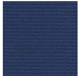
Dunkelblau | dark blue