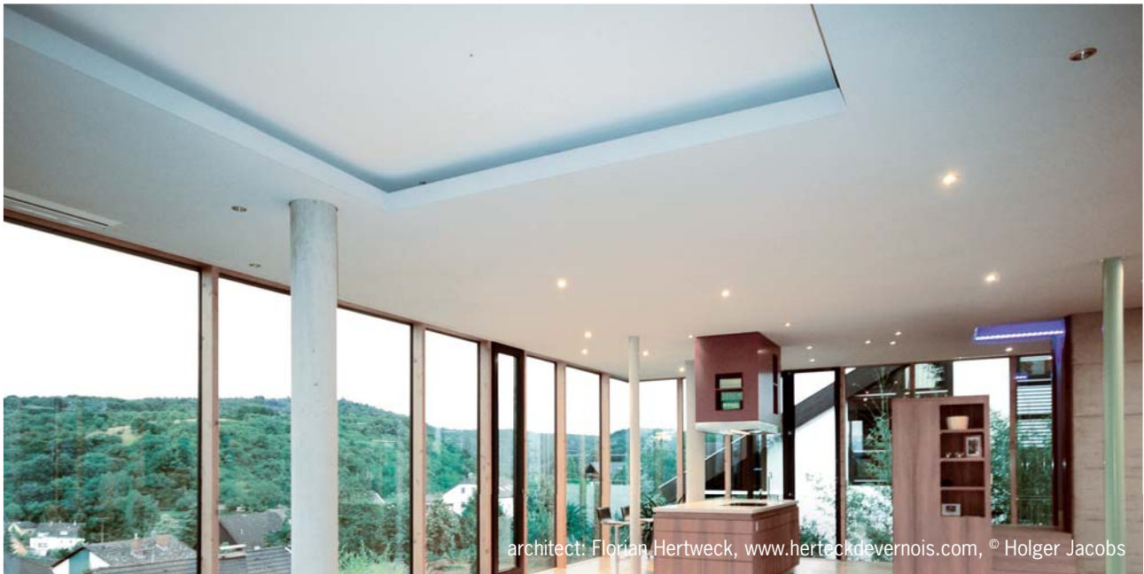
architect: Florian Hertweck, www.herteckdevernois.com