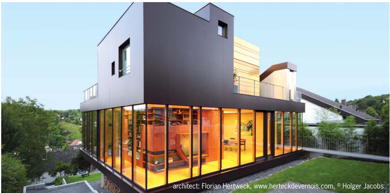
architect: Florian Hertweck, www.herteckdevernois.com , © Holger Jacobs