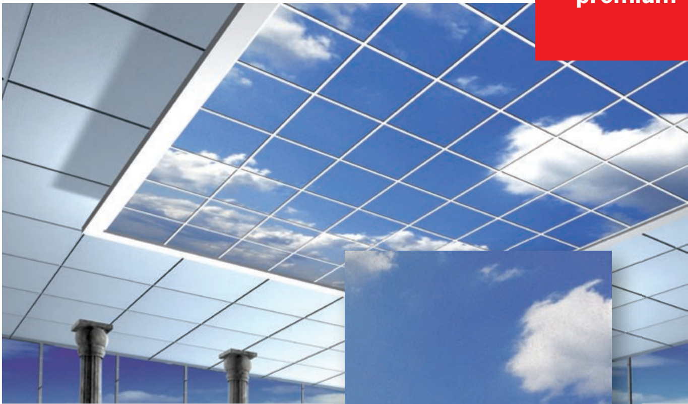
Oppervlakedessin Creaprint Schlicht 9