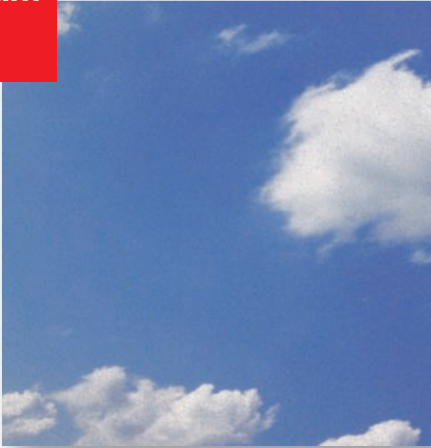
OWAcoustic® Creaprint Schlicht 9 bedrukt