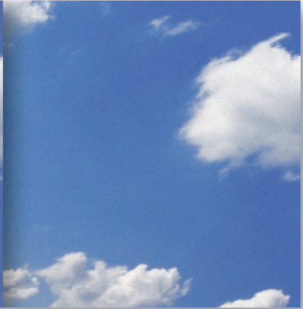
OWAcoustic® Creaprint Sternbild 3 bedrukt